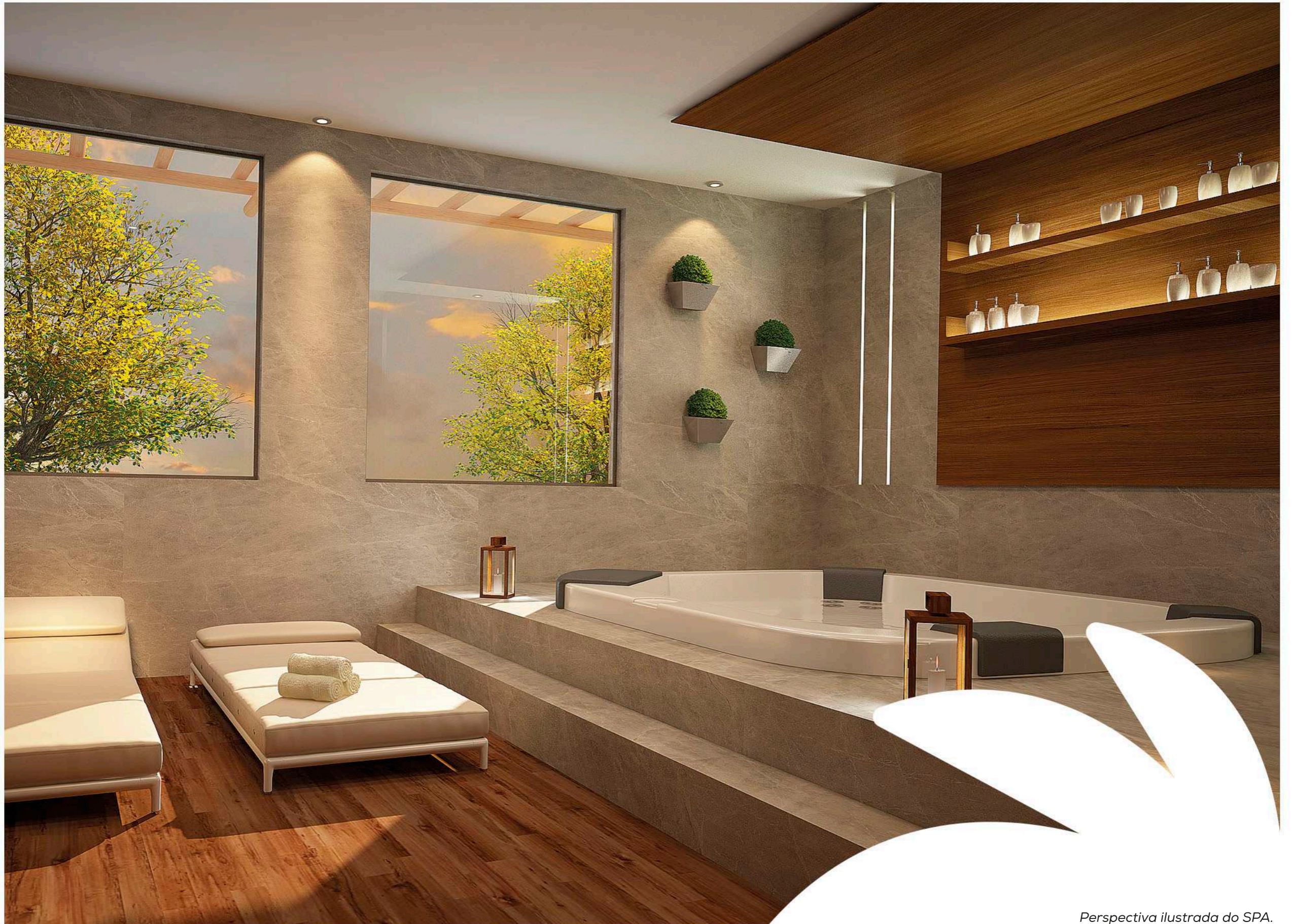
Perspectiva ilustrada do SPA.