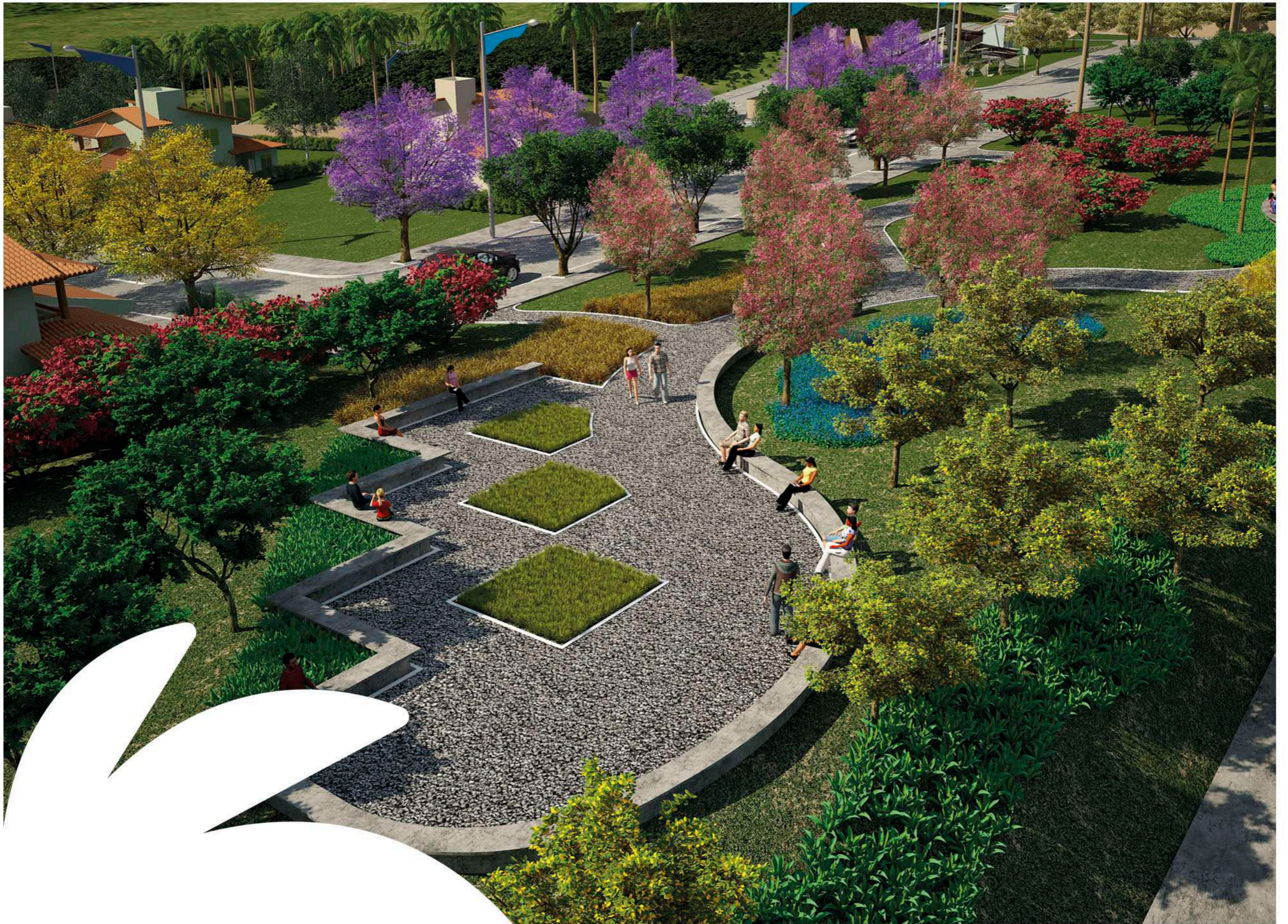
Perspectiva ilustrada aérea da praça.