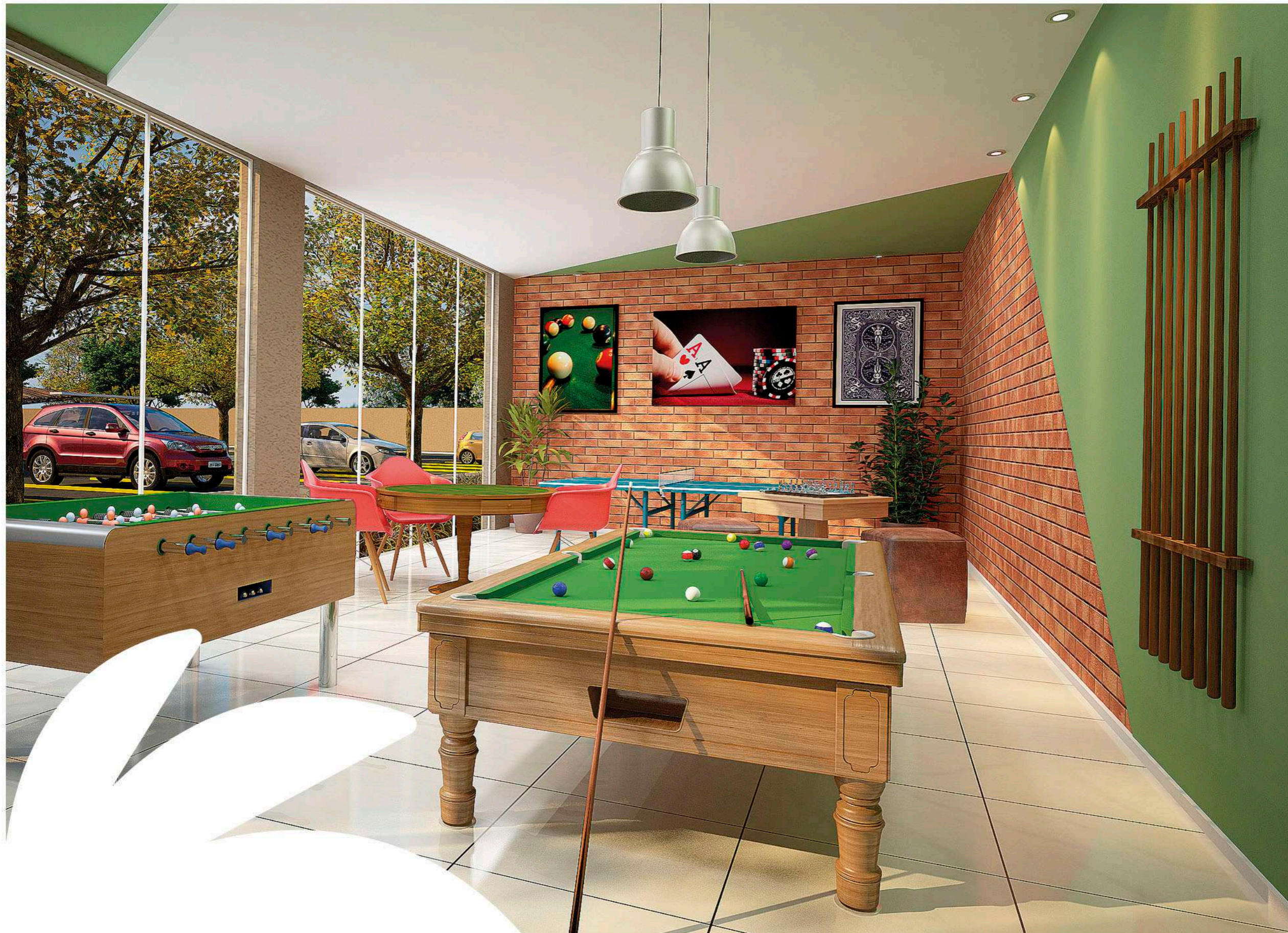
Perspectiva ilustrada do Salão de Jogos.