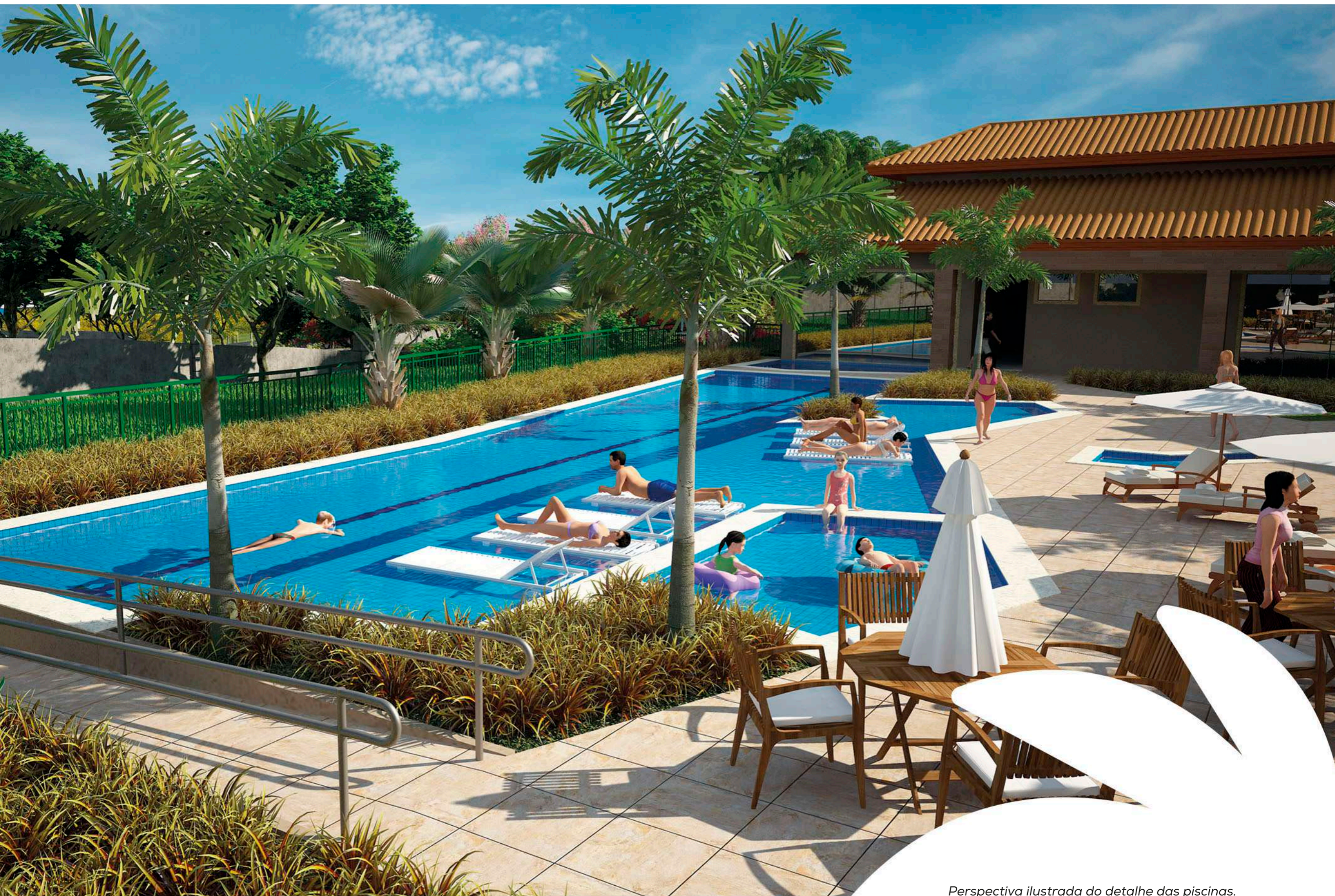
Perspectiva ilustrada do detalhe das piscinas.