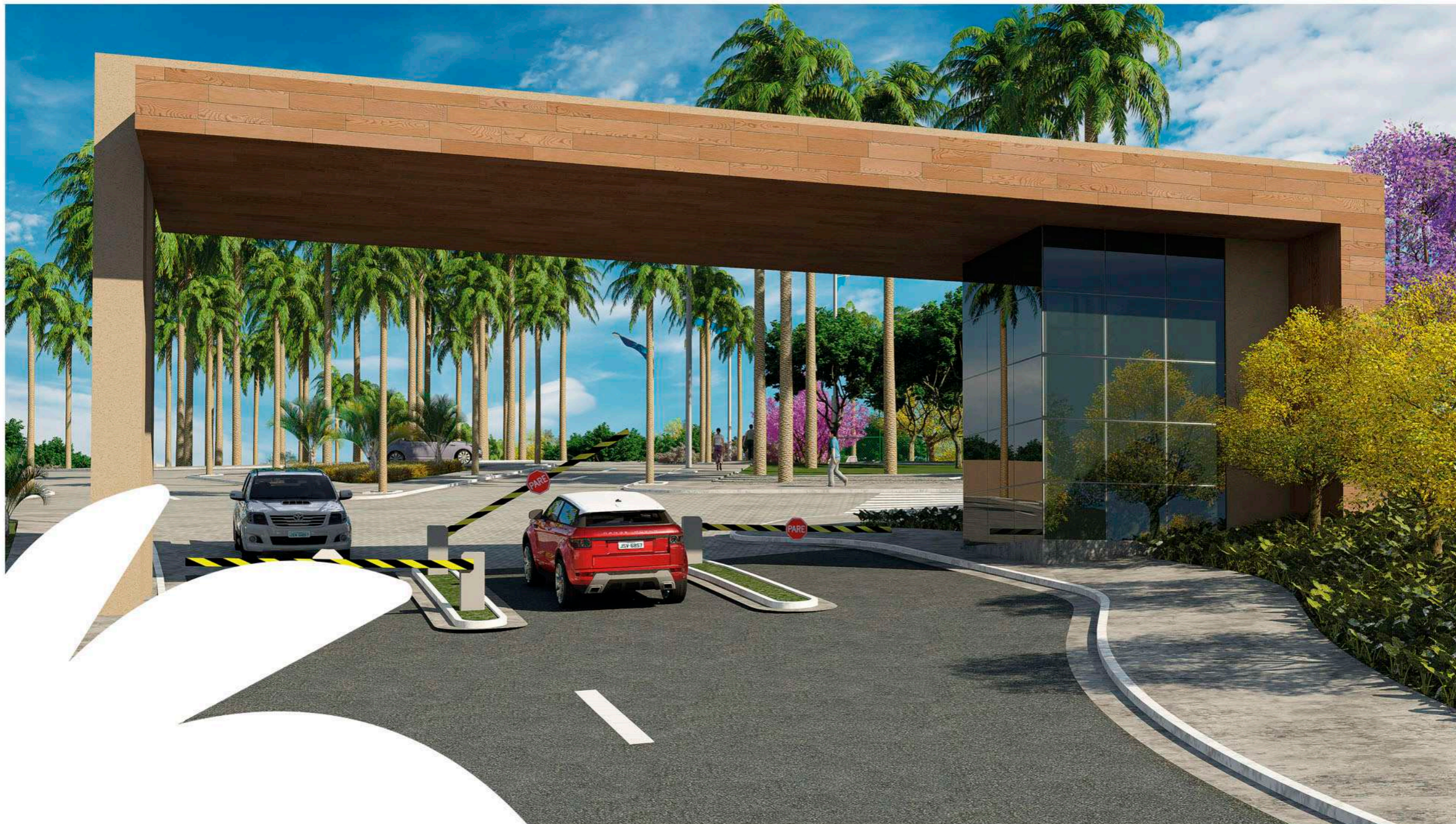
Perspectiva ilustrada da guarita.