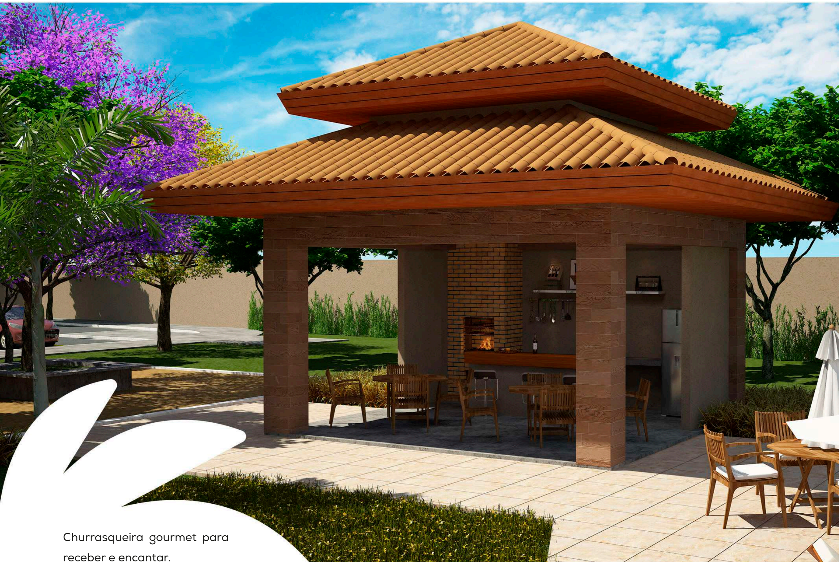
Churrasqueira gourmet para receber e encantar.