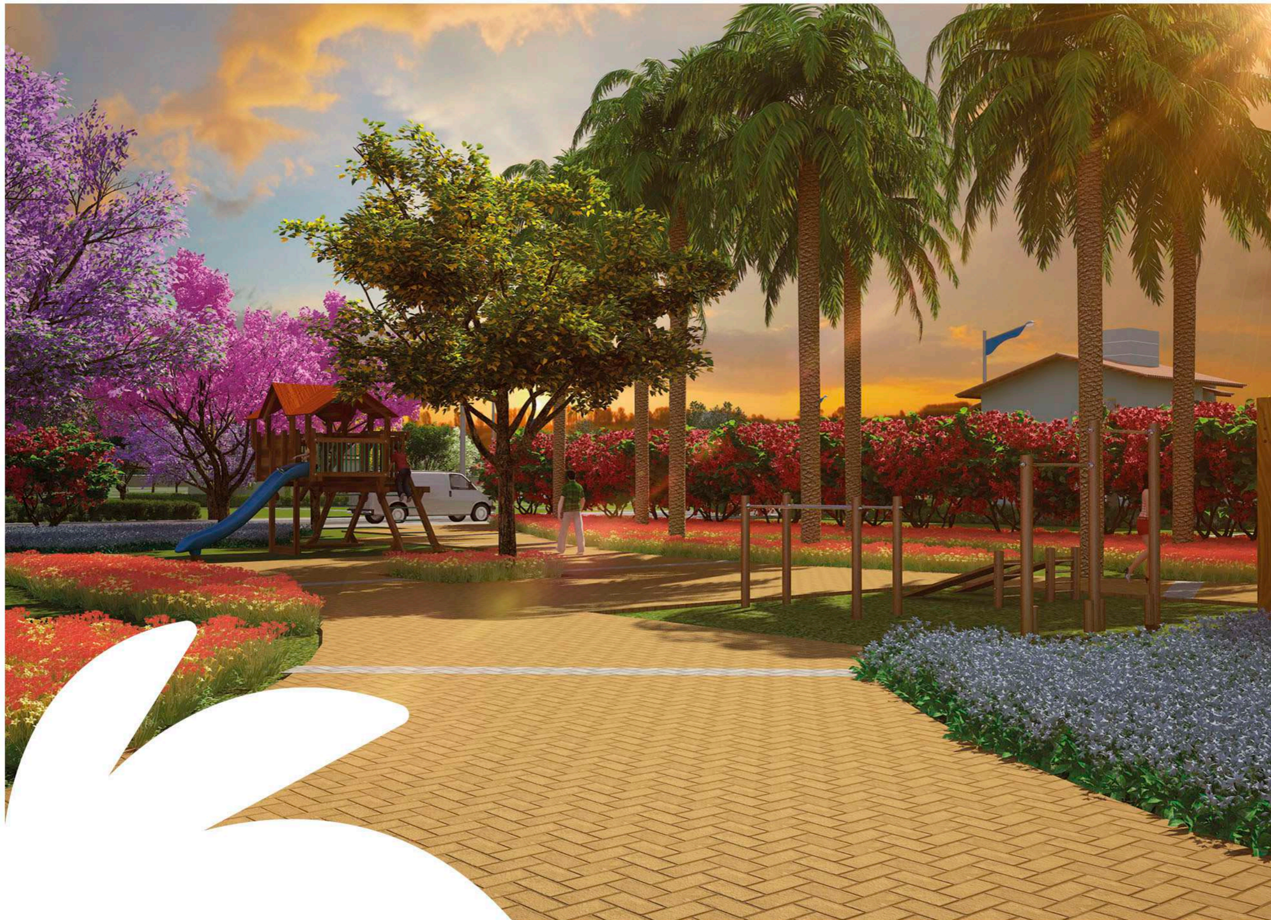
Perspectiva ilustrada do acesso a área comum.