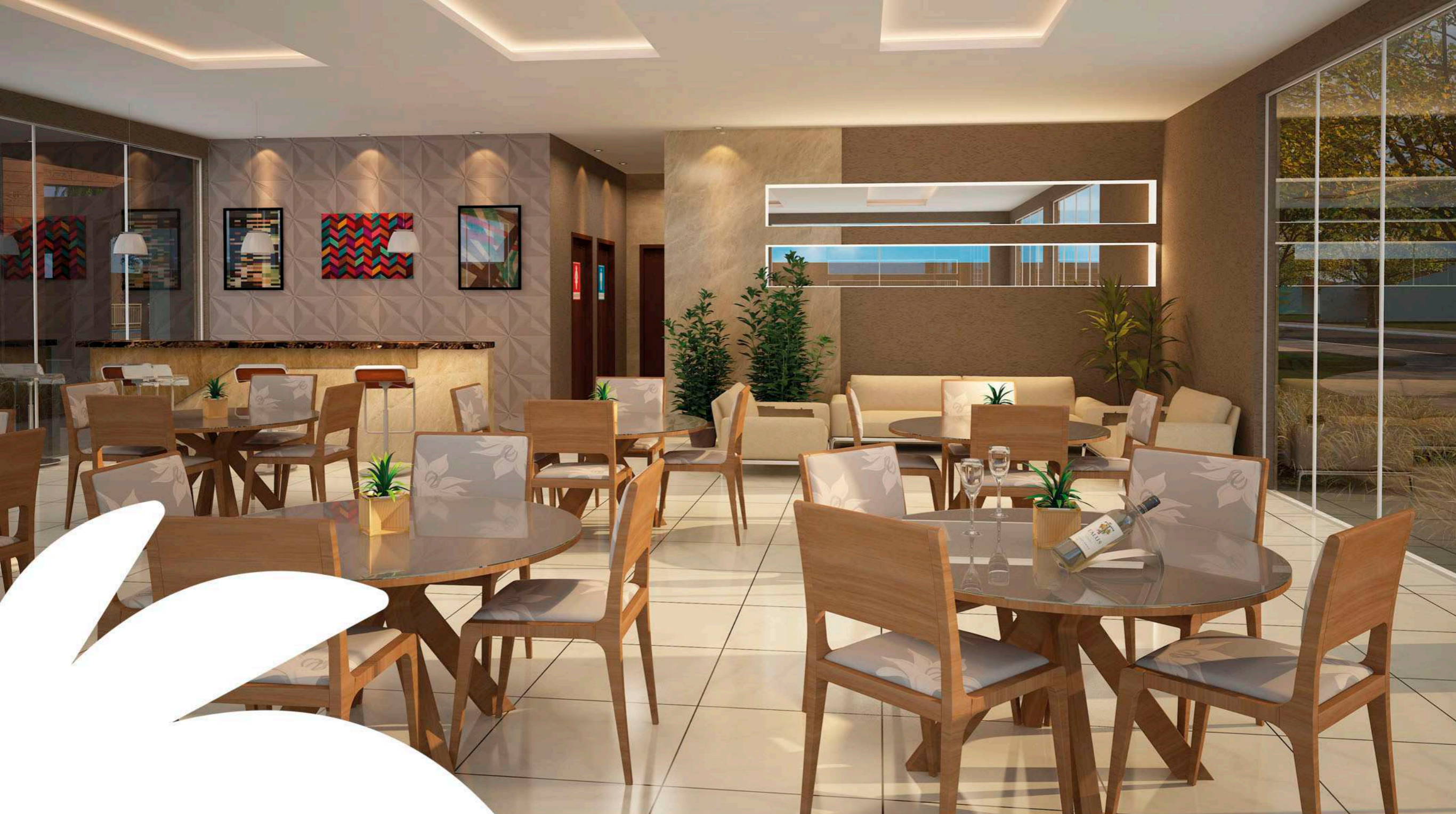
Perspectiva ilustrada do Salão de Festas.

Lazer adulto e infantil. O salão de festas do Petrópolis Residence foi feito pra quem tem bom gosto e aquela vontade de celebrar.